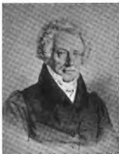
Lukas Joh. Boër.